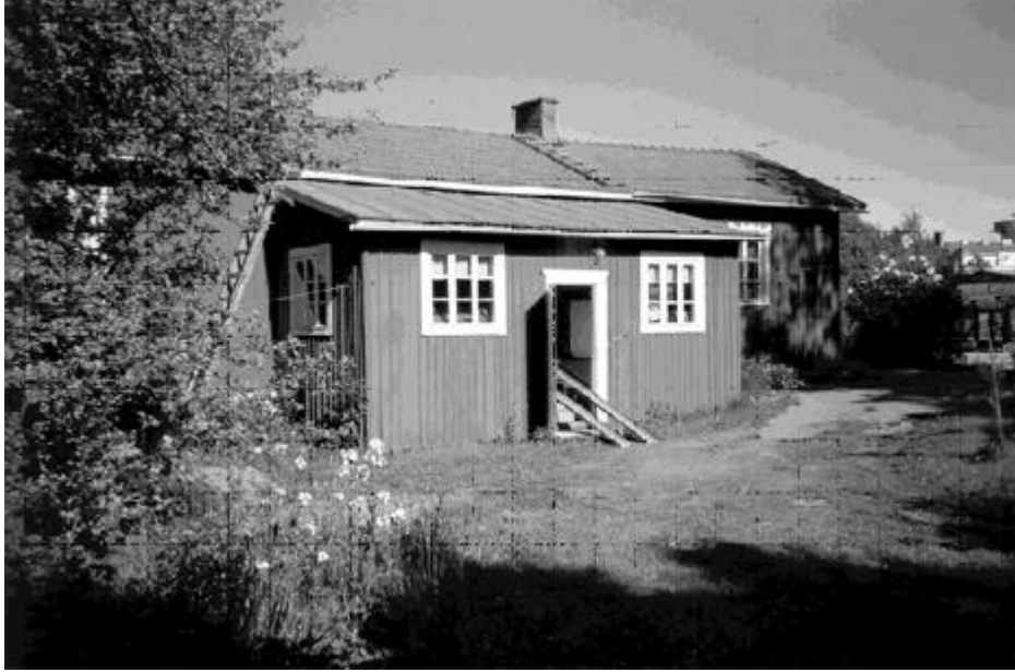
Tulevan ompelijamuseon piha iltapäivän auringonpaisteessa. Elersin tyttärien aikaan kummallakin pappilan mamsellilla oli oma sisäänkäyntinsä.