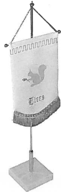
Pöytäviiri 26 €