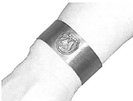
Rannerengas 70 €