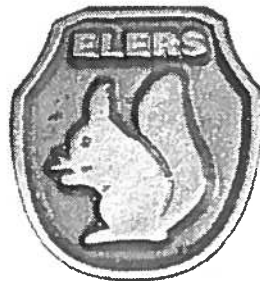
Rintamerkki 10 €