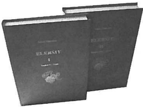
Sukukirjat osa 1 ja 2 (sisältää CD-rompun täydennystietoja)