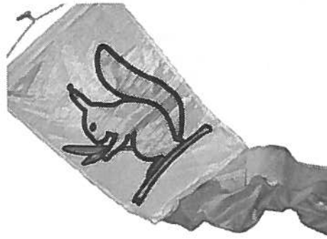
Salkoviiri 4 tai 5 m