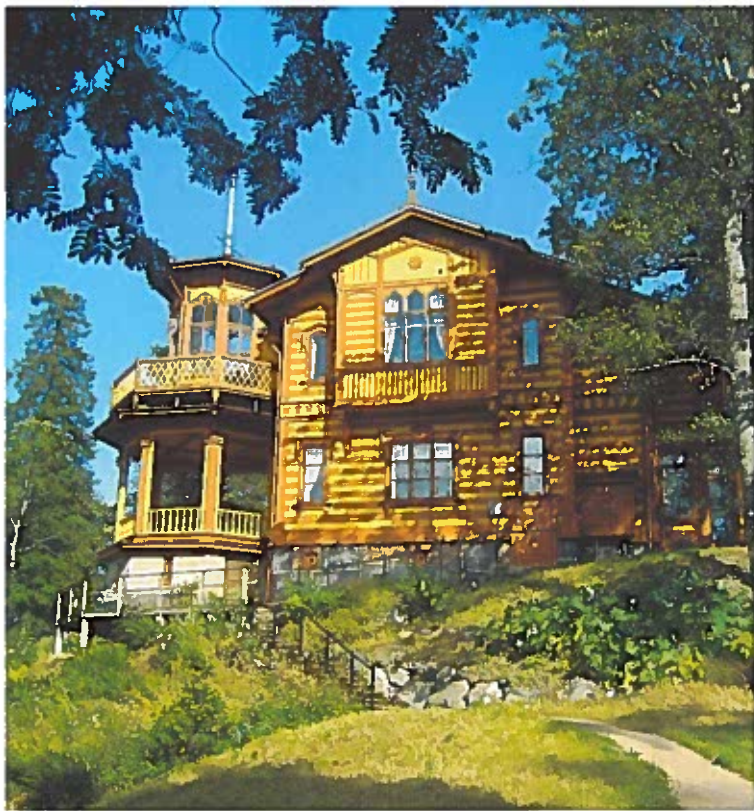
Aino Acktén huvila on Helsingin Laajasalossa Tullisaaren osa-alueella sijaitseva historiallinen huvilarakennus, joka toimii nykyisin kaupungin omistamana kulttuuritilana.