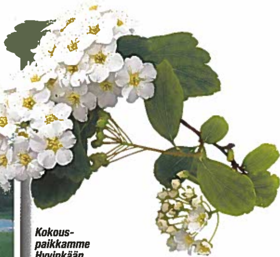
Kokous- paikkamme Hyvinkään työväentalo.