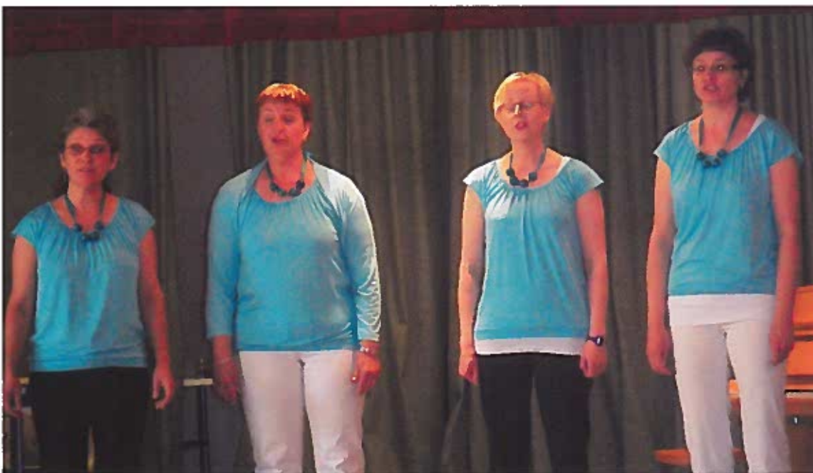
Loimaalainen naiskvartetti Kimpasa viihdytti sukukokouksen väkeä.